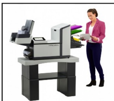
DS-64i | FPi-2700