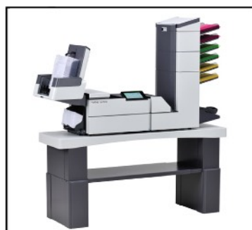
DS-85i | FPi-5700