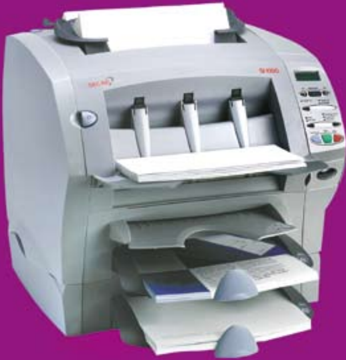
PLEGADORA ENSOBRADORA MS-SI1000